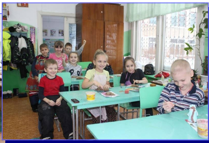
д\о «Природа и фантазия»